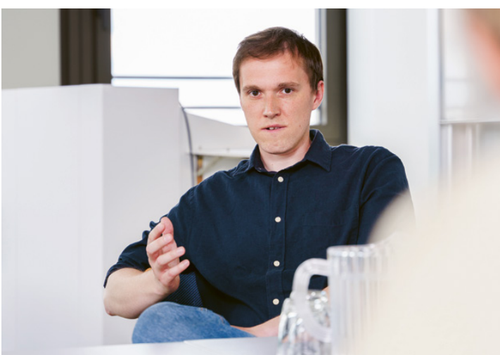
© HSBI, HSK, April 2023 — Fotos: Patrick Pollmeier, Felix Hüffelmann

Hochschule Bielefeld Fachbereich Gesundheit Interaktion 1, 33619 Bielefeld ➤ www.hsbi.de/gesundheitsbereich