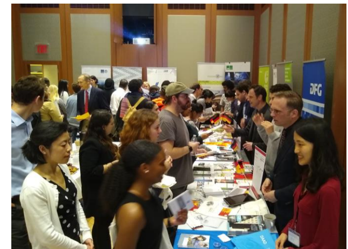
Germany Grad Fair im German House 2019