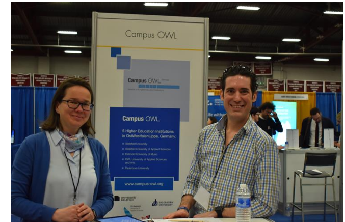
European Career Fair, 2020