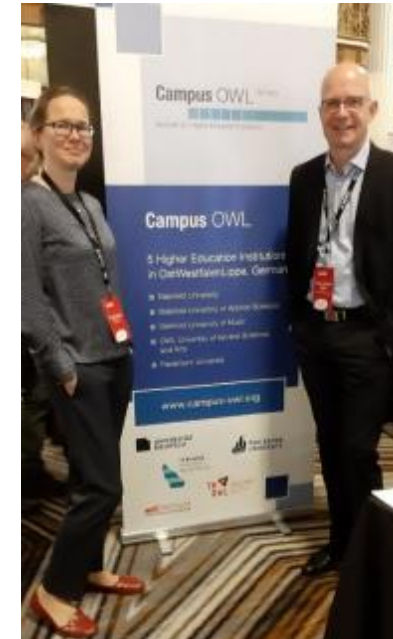
GAIN San Francisco, 2019