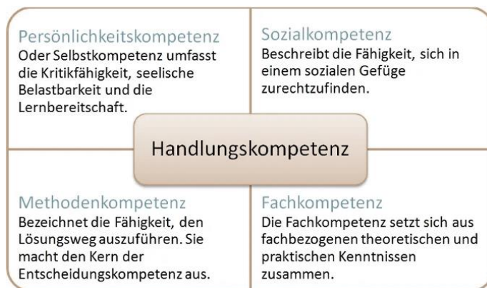
Abbildung 1 – Handlungskompetenz 88

In der stationären Vorsorge- oder Rehabilitation wird die Handlungskompetenz in allen therapeutischen Einheiten auf unterschiedliche Weise gestärkt: z.B. durch Wissensvermittlung, Wahrnehmungsschulung, Einüben neuer und gesundheitsfördernder Verhaltensweisen, u. a. m.